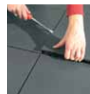
Kant- och Hörnlist