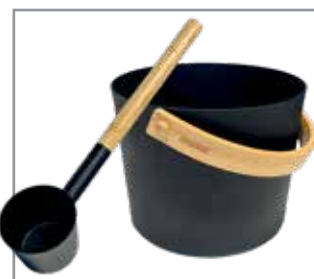
Sauna stäva och skopa SAC10111