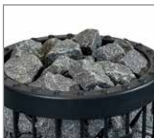
Bastu stenar, ø 10-15 cm AC3020