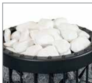
Dekorationsstenar ø 5-10 cm AC4000