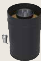
Spjäll till stålskorsten WHP270SPM