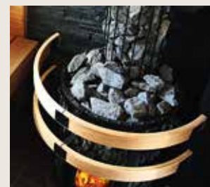
Legend skyddsräcke SASP0240