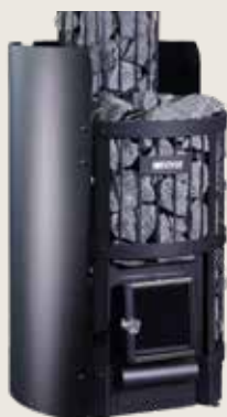
Skyddsvägg för bastuugn WL200